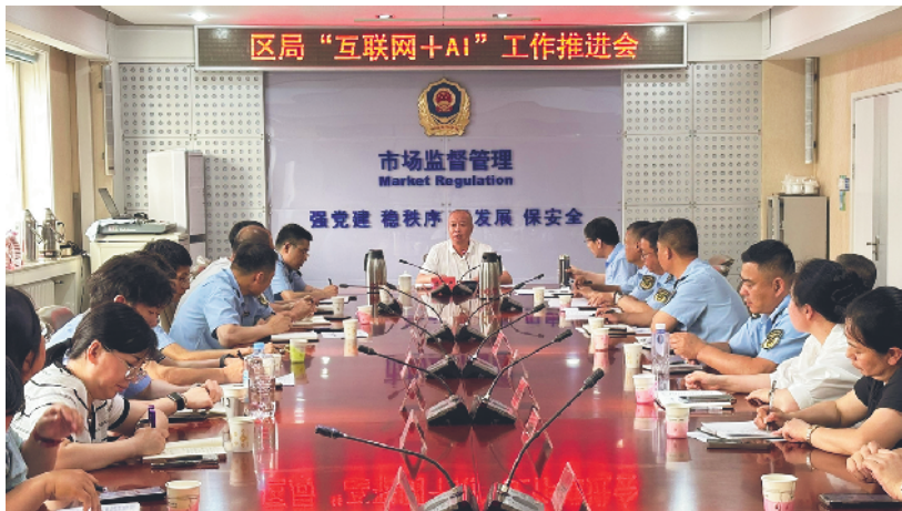
延庆区市场监管局“互联网+AI”监管工作推进会现场。

会上,餐饮科、食品科负责人通报了当前全局“互联网+AI”监管平台推进落实情况,明确了阶段性目标任务和最新工作要求,精准梳理了工作推进过程中存在的堵点、难点问题,为后续工作靶向推进指明了方向。随后,各市场监管所所长结合基层工作实际,逐一就商户对接、存在问题等方面进行深入交流探讨。