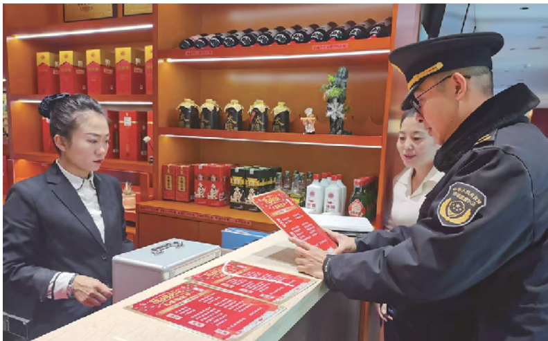
执法人员检查餐饮经营主体。

检查过程中执法人员提示餐饮服务单位:一是规范经营行为,切实承担起食品安全主体责任;二是明示反食品浪费标示,在经营场所显著位置张贴反食品浪费宣传材料,主动提示消费者适量点餐;三是严禁以营利为目的以各种所谓打折、优惠、满减等活动误导消费者为省钱多下单导致餐饮浪费;四是提示餐饮服务单位不得设置最低消费门槛。此次共检查食品经营主体6户,对一起1食品经营许可证载明的经营项目发生变化未按照规定申请变更的违法行为已立案调查。