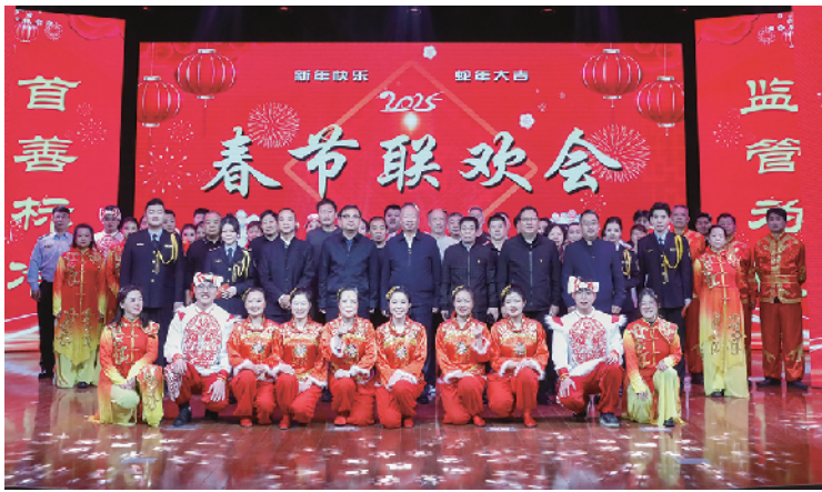
延庆区市场监管局春节联欢会现场。

联欢会在欢快喜庆的开场舞《过年了》中拉开序幕。鼓舞《精忠报国》刚劲有力,演绎出豪迈的英雄气概;情景剧《“假较劲”和“真打假”》诙谐幽默,道出了大家在处理举报投诉时的艰辛不易;歌舞《new boy》青春洋溢,唱出了青年干部的蓬勃朝气;快板书《说说我们永宁所》生动写实,描述了基层市场监管所干部的风采与担当;诗朗诵、小合唱《不忘初心》慷慨激昂,表达了市场监管人“监管为民”的信心和决心……《上春山》《山西家信》《拥抱改革时代 书写市监情怀》《子