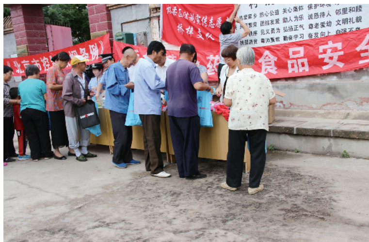
桥梓镇食药所进村宣传