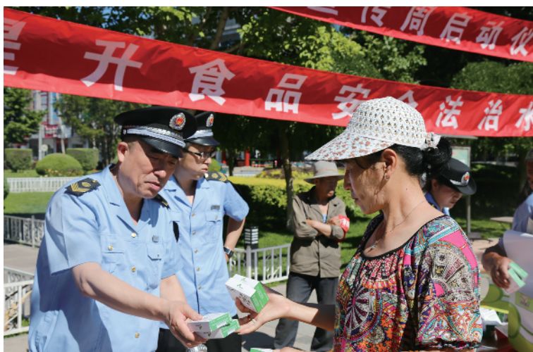
启动仪式上发放宣传材料