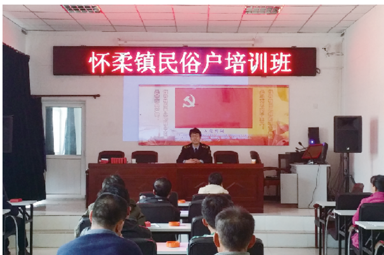
怀柔镇食药所开展民俗户食品安全培训