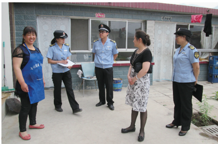
宝山镇食药所进民俗村入户宣传