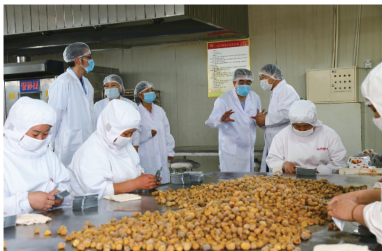
稽查大队深入企业检查工作