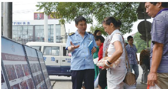
管庄地区食药所组织开展食品安全宣传周活动