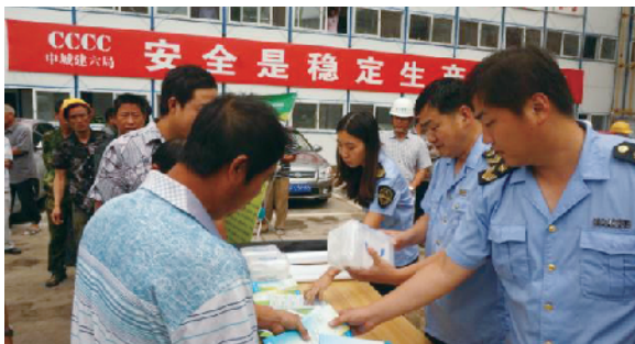
来广营食品安全宣传进工地活动