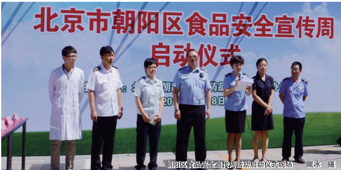
朝阳区食品安全宣传周活动启动仪式现场

当天清晨,在潘家园华威北里小公园,晨练的老人、赶早市经过这里的大妈们停下了脚步,潘家园食药所工作人员在这里开展了一场信息量极其丰富的食品药品安全宣传活动。宣传人员拉起食品安全宣传周的宣传横幅,支起桌椅,接受群众的咨询,向群众讲解食品、药品、医疗器械、化妆品安全知识,让大家掌握基本食药常识,同时注意维护自身权益,积极参与食药的共管共治,共同“把脉”自己“舌尖上的安全”。